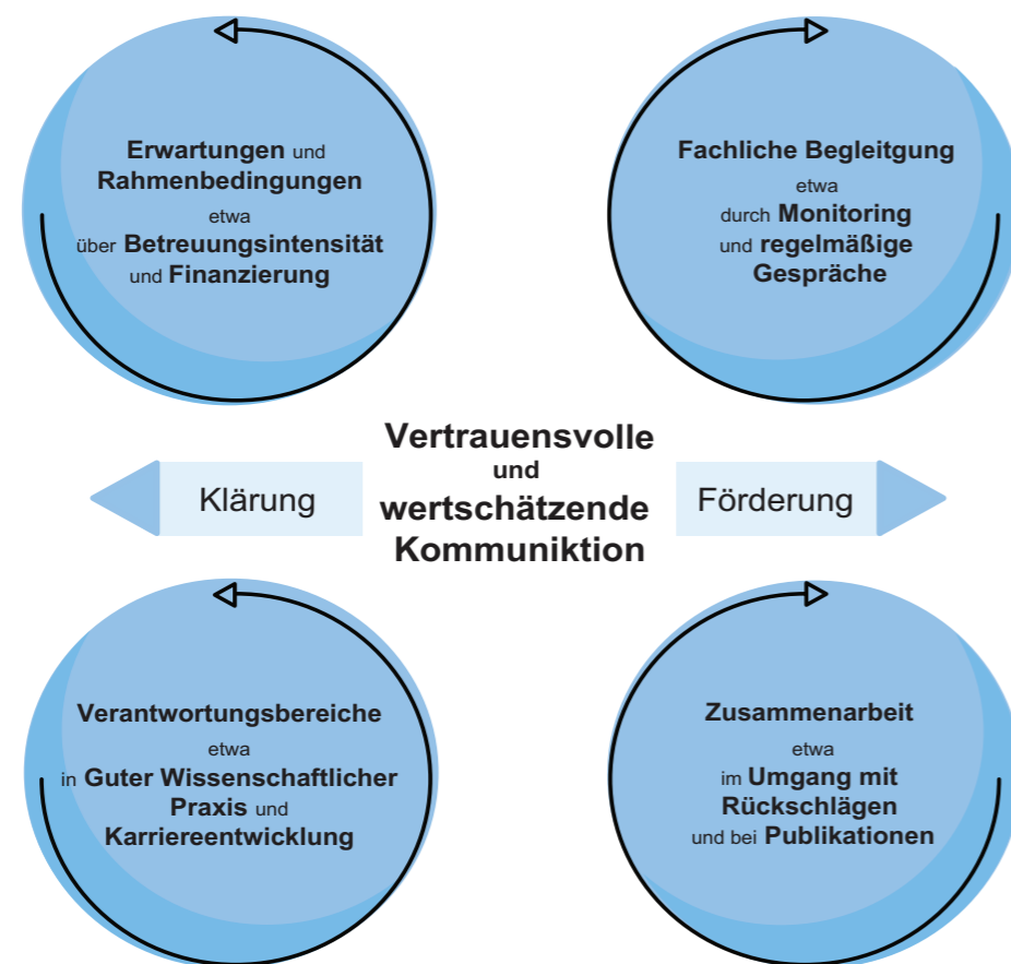
Abb. 1: Gute Kommunikation im Betreuungsverhältnis

Die Basis für eine erfolgreiche Zusammenarbeit zwischen Betreuenden und Promovierenden ist ein von wechselseitigem Vertrauen geprägtes Betreuungsverhältnis, in dem der fachliche Rat der Betreuer*innen ebenso wie die selbstständige Forschung der Promovierenden gleichermaßen geschätzt wird. Zentral und unabdingbar ist dabei eine offene und wertschätzende Kommunikation zwischen den Beteiligten. Unabhängig von dem jeweiligen Betreuungsmodell – ob etwa im Rahmen einer klassischen Eins-zu-eins-Betreuung oder einer Betreuung im Team – bilden Betreuer*innen und Promovierende eine Forschungsgemeinschaft, die im Optimalfall für alle Beteiligten eine Win-win-Situation darstellt: Die Betreuer*innen investieren viel Zeit in ihre Promovierenden. Sie begleiten sie durch die gesamte Promotionszeit, geben fachlichen Rat und unterstützen sie umfassend in ihrer wissenschaftlichen Entwicklung zu eigenständigen und kreativen Forschenden. Die Promovierenden wiederum leisten mit ihrer Forschung einen zentralen Beitrag zum wissenschaftlichen Erkenntnisfortschritt und tragen dadurch nicht zuletzt den Ruf ihrer Betreuer*innen in der wissenschaftlichen Gemeinschaft weiter.